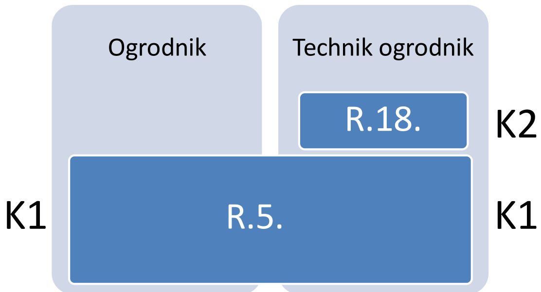
Rysunek M2.1. Zależności między zawodami ogrodnik i technik ogrodnik

Szczegółowe informacje o zawodzie technik ogrodnik znajdują się w publikacji Informator o egzaminie potwierdzającym kwalifikacje w zawodzie – Technik ogrodnik 314205 .