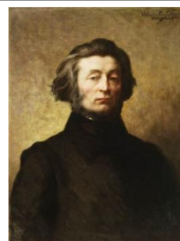
Adam Mickiewicz (1798–1855) – jeden z najwybitniejszych poetów polskich, działacz polityczny, publicysta.